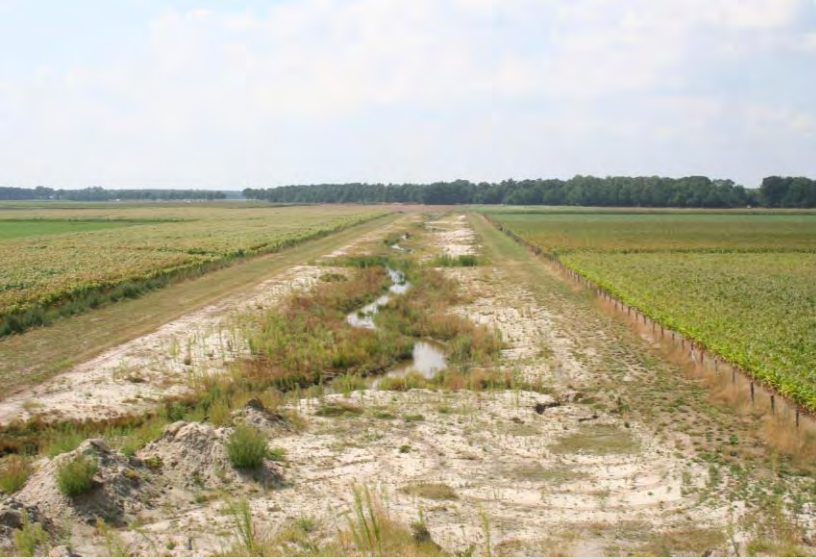
Putbeek : 2005 direct na herinrichting