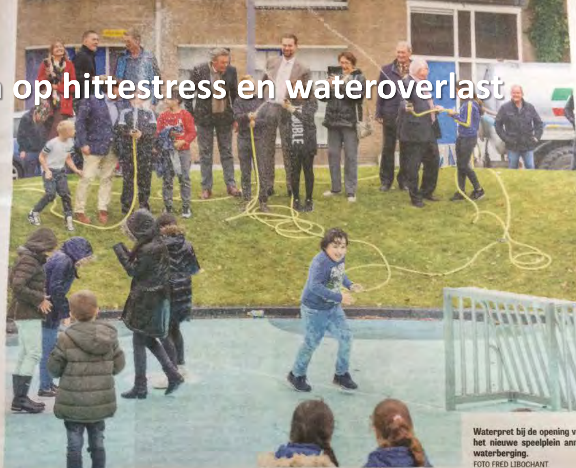
Waterpret bij de opening van het nieuwe speelplein aan de waterberging.

inspelen op hittestress en wateroverlast